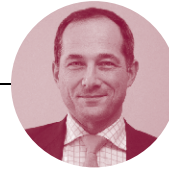
Frédéric Oudéa Directeur général de la Société Générale