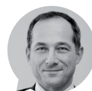
Frédéric Oudéa Directeur général de la Société Générale