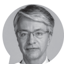
Jean-Laurent Bonnafé Président de la FBF Administrateur directeur général de BNP Paribas