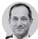
Frédéric Oudéa Vice-président de la FBF Directeur général de la Société Générale